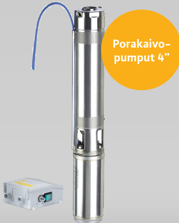
Porakaivo- pumput 4"